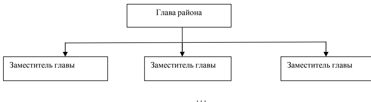
Рисунок 1 – Структура администрации района

Если на рисунке отражены показатели, то после заголовка рисунка через запятую указывается единица измерения, например: